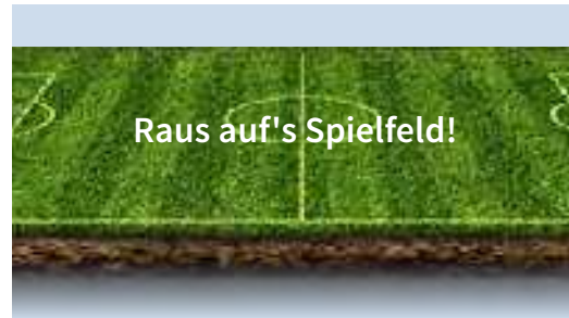
Ob Stadt oder Land: