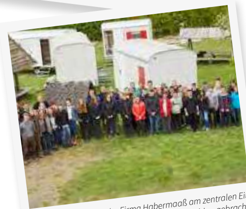
Die Auszubildenden der Firma Habermas am zentralen Einbauplatz kurz bevor sie an die endgültige Position gebracht wurden.

Camp sind alle zu einer Einheit zusammen gewachsen. Weitere Besonderheiten sind die Tagestour, die ich von keinem anderen Camp so kenne, die Vielzahl an Angeboten, die Zeugnisse am Abend im Kaminzimmer und das Gott an jedem Punkt des Tages mit dabei ist.