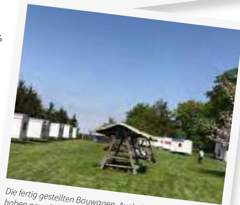
Die fertig gestellten Bauwägen. Auch die Sitzgelegenheiten haben neue Dächer bekommen.