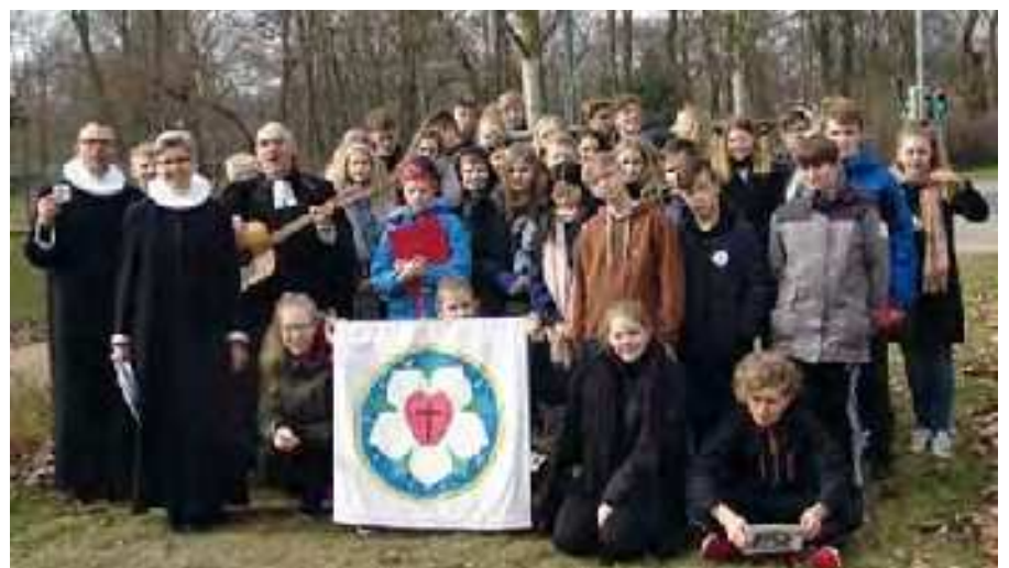
Deutsch-dänische Jugendbegegnung 2017 mit Pflanzen eines Lutherbaumes

Jugendarbeit auf dem Land – das bedeutet, dass in den Orten oft nur wenige Jugendliche wohnen, manchmal nur einer – und dass man froh ist, sich zu treffen. Da ist die einfache Begegnung, und manchmal wird eben noch mehr daraus: Wie jetzt, wo Besuch aus den USA kommt. Auch an unserem Jugendhäuschen haben ja nicht nur wir gewerkelt – und tun das immer wieder – sondern auch schon Freunde aus Seattle, die mit uns die Treppe einbauten und Balken erneuerten.