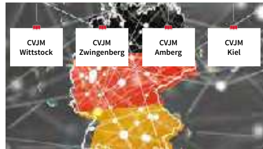
Vier Vereine stellen sich vor