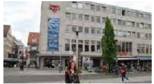
Groß gegen klein – das ist gemein!?