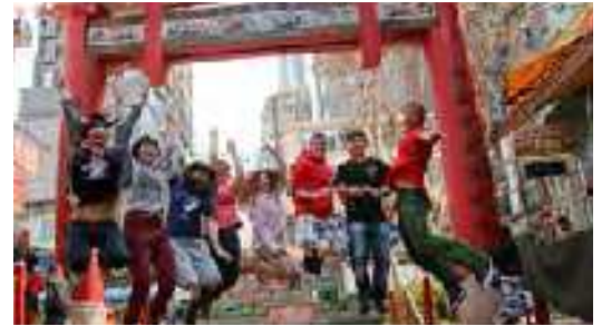
»Sie lieben es, Menschen zu vertrauen.«