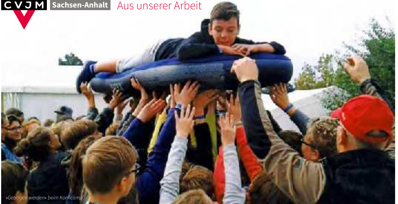
»Getragen werden« beim Konficamp