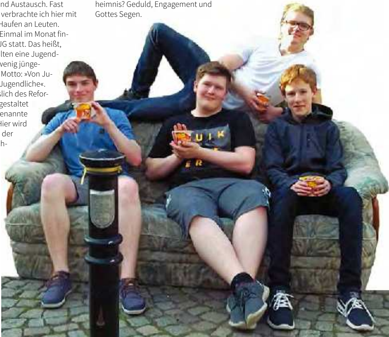
Jugendliche aus der Jungen Gemeinde in Stolberg

Mitarbeiter im Freiwilligen Sozialen Jahr (FSJ) beim CVJM Sachsen-Anhalt